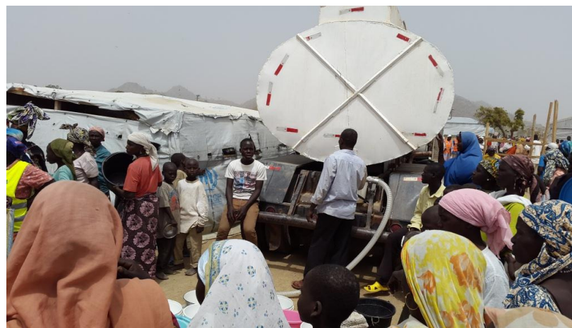
Approvisionnement du camp de Minawao en eau au par une équipe de MSF.